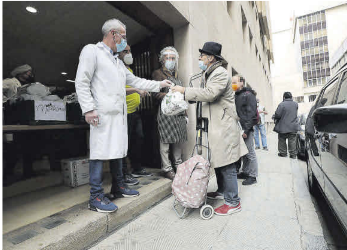
Más diferencia entre ricos y pobres. Reparto de alimentos a las puertas de un comedor social en Zaragoza.

que tienen los 10 hombres más ricos del mundo, entre todos suman más dinero que la mitad de la gente que vive en el mundo.